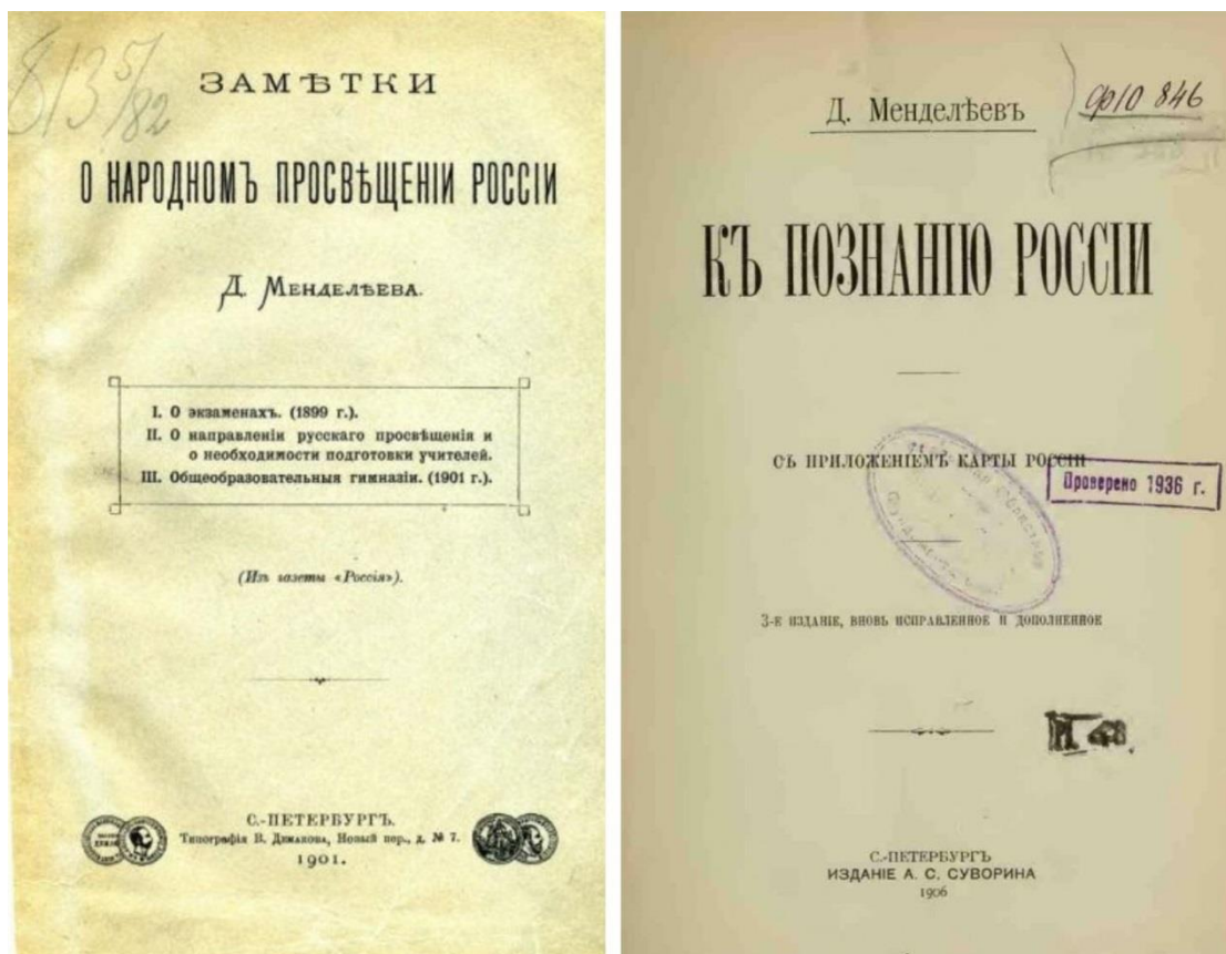
Труды Дмитрия Менделеева.

"В идеале мне рисуется дело это так: начальная школа в каждой деревне, младшие классы средней школы в каждом селе, старшие – в каждом городе, а то или иное высшее учебное заведение в каждом губернском городе", – писал он. Менделеев выступал за преемственность программ начального, среднего и высшего образования; за свободный доступ в вузы одаренных детей всех сословий; за максимальное приближение школьной программы к требованиям реальной жизни – в частности, за изъятие из нее бессмысленных мертвых языков.