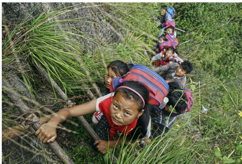
Деревня Атулеэр провинции Сычуань, Китай.

"Может быть", – сказал он, "это связано с одним новым обычаем, который стал очень распространён в коммунистическом Китае". Когда нашему герою едва исполнилось 14 лет и он закончил очередной учебный год, его, как сына известного в области чиновника отправили... работать учителем в отдаленную деревню в горах. Это у нас 14 летний пацан ещё совсем ребёнок. У них же считается, что он давно закончил начальную школу, и поэтому может поделиться своими знаниями с подрастающим поколением. Отправляют детей всех чиновников, причём, чем чиновник выше по рангу, тем в более отдалённую деревню отправится его отпрыск на всё лето работать учителем.