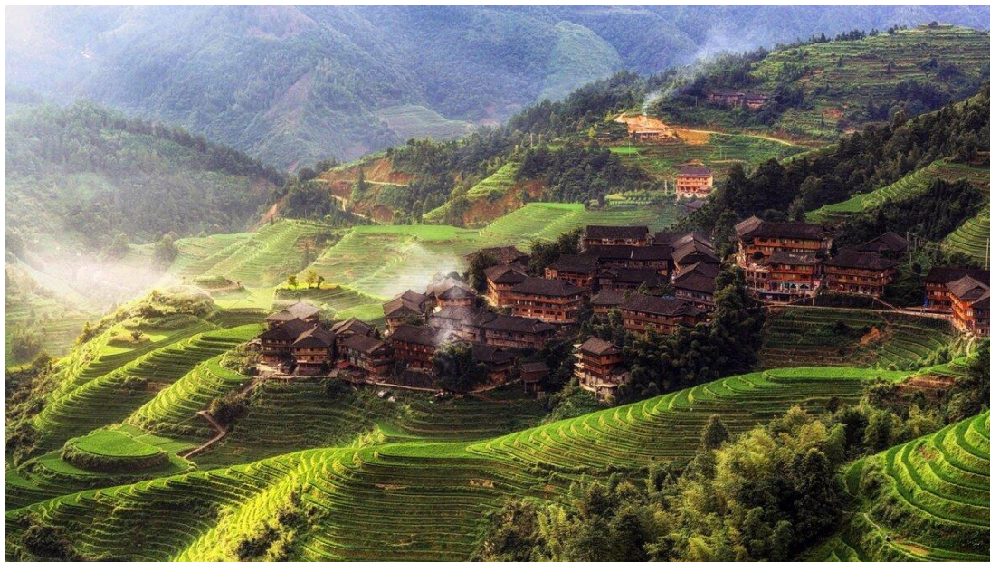
Деревня Тянь Тоу, Китай.

Эту историю я услышала из первых уст самого героя, в настоящее время успешного архитектора, кроме родного китайского свободно говорящего на двух иностранных языках. В дружеском кругу мы обсуждали экономические успехи Китая, и он поделился одним "секретом".