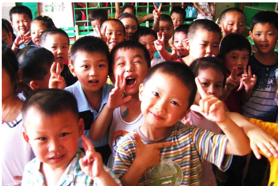
Китайские дети.

сердечно принявших меня. Это был, пожалуй, самый затруднительный момент в моей тогдашней жизни. Ещё было крайне неожиданно, что тебя, школьника, 14 летнего подростка, настолько уважают и почитают. В эти мгновения я будто бы стал сразу старше и солиднее". По словам нашего приятеля, после возвращения с таких "каникул" он стал учиться ещё лучше, больше читать.