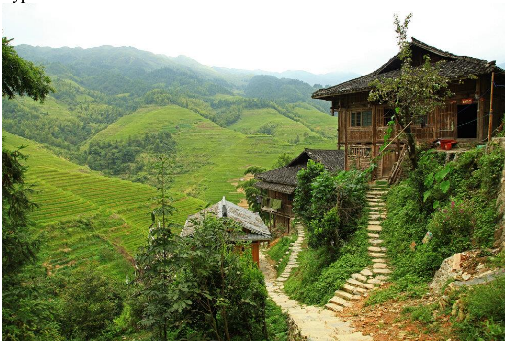
Деревня Дажай, Китай. cookiesound.com

Крестьяне работают на полях, выращивая рис и овощи. Деревни часто не настолько большие, чтобы строить для детей государственную школу. Дети постарше потом ходят в школу одну на несколько деревень. А вот для младших детей, от 5 до 8 лет, часто устраивают вот такие "летние школы", где они учатся читать и писать иероглифы, получают элементарные математические знания, базовый уровень английского языка.