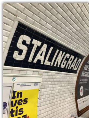
Станция метро «Сталинград» в Париже

Площадь Сталинград в Париже – не единственное место в стране, носящее имя города-героя на Волге, напрямую связанного с битвой. Франция занимает первое место в мире по упоминанию Сталинграда в топонимике. Мы обнаружили, что у них в каждом большом городе есть улица или площадь имени Сталинграда. Если в автомобильный навигатор ввести название города-героя, он выдает 167 мест. Это больше, чем в других странах мира вместе взятых. Среди объектов можно отметить автозаправки, центры красоты, мельницы, станции скорой помощи, транспортные агентства, частные компании, аптеки и еще много чего.