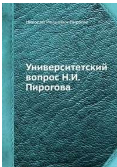
Николай Иванович Пирогов "Университетский вопрос Н.И. Пирогова"

Пирогов понял, что голос интуиции, к которому он научился прислушиваться, может выдавать столь же правдивую информацию, как результаты любого эксперимента, и этому голосу можно доверять. Он писал в своем дневнике, что жалеет, потому что не научился пользоваться этим естественным инструментом раньше. Именно интуиция, а не знания, подсказала Пирогову идею о том, что во Вселенной существует более разумная, чем люди, сила , которая общается с нами посредством нашего мозга.