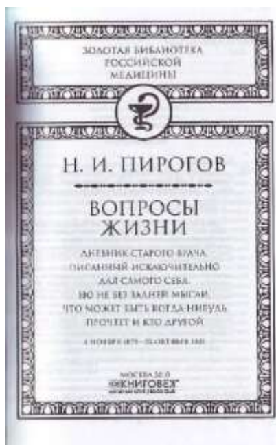
дневник Николая Пирогова

Пирогов понял, что голос интуиции, к которому он научился прислушиваться, может выдавать столь же правдивую информацию, как результаты любого эксперимента, и этому голосу можно доверять. Он писал в своем дневнике, что жалеет, потому что не научился пользоваться этим естественным инструментом раньше. Именно интуиция, а не знания, подсказала Пирогову идею о том, что во Вселенной существует более разумная, чем люди, сила , которая общается с нами посредством нашего мозга.